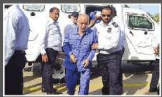
تأجيل محاكمة عدد من رموز ومسؤولي النظام السابق...