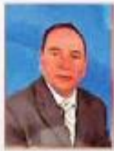
الإستاذ المعاصر : السيد المعاصري